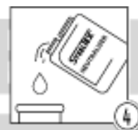
Шаг 4 - Нейтрализация кислотности теплообменника