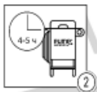
Шаг 2 - Очистка системы с ультразвуком®