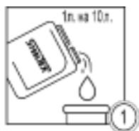
Шаг 1 - Приготовление промывочного раствора