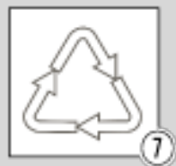
Шаг 7 - утилизация промывочного раствора

При применении рекомендуется использовать защитные очки Pipal® SteelTEX® EYE PROTECTION , перчатки Pipal® SteelTEX® HAND PROTECTION и респиратор Pipal® SteelTEX® RSP , защитную обувь Pipal® SteelTEX® SAP .