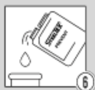
Шаг 6 - Пассивация